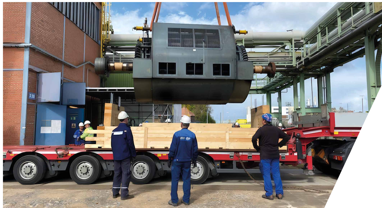
Enlèvement du générateur endommagé par nos collaborateurs spécialisés