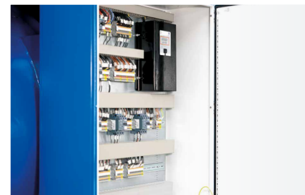
Boîte à bornes auxiliaire avec régulateur de tension